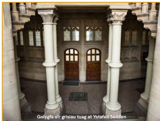
Golygfa o'r grisiau tuag at Ystafell Seddon