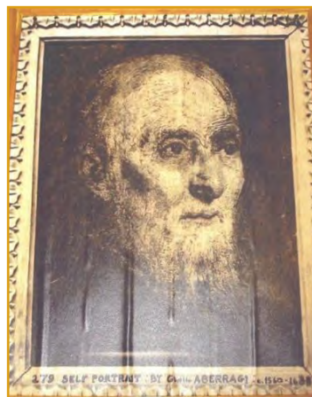
Givetto Aberragi, wedi'i arddangos am 10 diwrnod yn yr Oriel Genedlaethol

Mae'r ymchwil ar gyfer yr Hen Goleg yn ymestyn y tu hwnt i wrthrychau. Rydym yn casglu hanes llafar y Brifysgol ac rwy'n gweithio ar brosiect gyda'r Adran Ddaearyddiaeth i fapio atgofion cyn-fyfyrwyr a Chymdeithas y Cyn-fyfyrwyr. Nid oes llawer o'n myfyrwyr presennol yn gwybod mai yn Aberystwyth yr oedd yr adrannau Gwleidyddiaeth Ryngwladol a Ddaearyddiaeth ac Anthropoleg cyntaf yn y byd. Ni wyddant ychwaith bod myfyrwyr Aberystwyth wedi cael sylw yn y wasg genedlaethol yn y 1960au am lwyddo i guddio portread ffug ar waliau'r Oriel Genedlaethol yn Llundain am sawl diwrnod i godi arian ar gyfer Wythnos Rag.