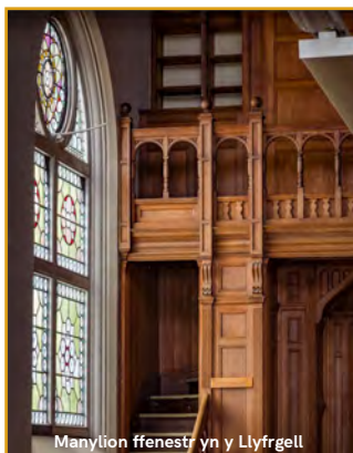
Manylion ffenestr yn y Llyfrgell