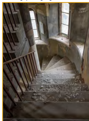
Y Tŵr - engrifftiau o ardaloedd yn yr Hen Goleg sydd angen gwaith helaeth