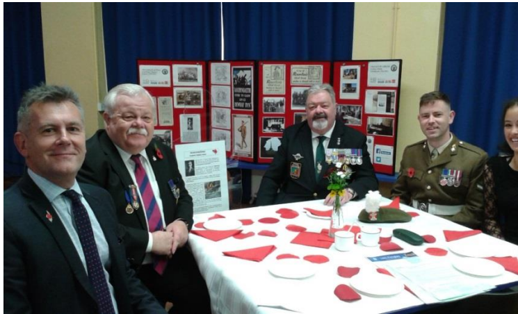
Te Cadoediad Ysgol Penglais, 9 Tachwedd 2018