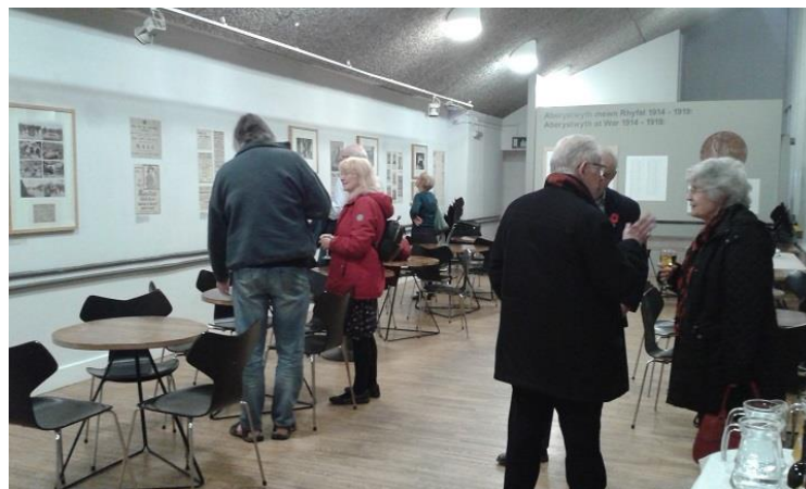
Lansio'r arddangosfa, nos Iau 8 Tachwedd 2018