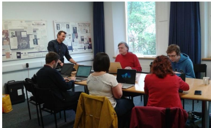
Wrthi'n ymarfer yn y cwrs hyfforddi ar archifau digidol, 2 Mai 2019

“The tutor explained everything efficiently and clearly which made my enjoyment levels high and meant that I learned a lot. I now understand the process of digitization, which will assist me in my future endeavours.”