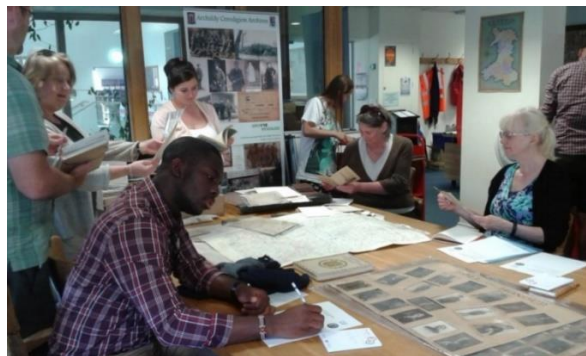
Sesiwn hyfforddi sgiliau ymchwil yn Archifau Ceredigion 19 Gorffennaf 2018

"I am very pleased with the direction of the project and I am looking forward to all information we can gather. The story behind each and every man is very particular, therefore understanding their lives and their paths that led to the war is very interesting."