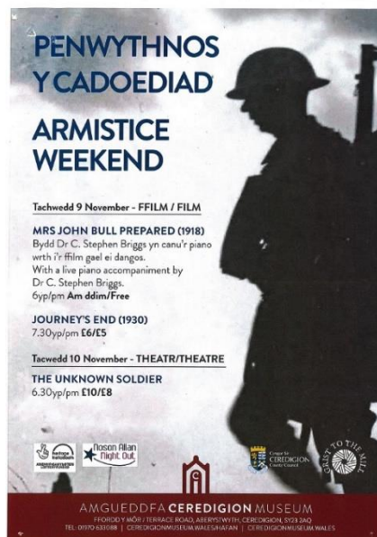
Poster noson ffilmiau Penwythnos y Cadoediad

Dangosiad 2, dydd Gwener 9 Tachwedd 2018, 6-9pm. I nodi penwythnos Cadoediad 2018, ar y cyd ag Amgueddfa Ceredigion cynhaliodd y prosiect eto fil dwbl o ffilmiau o’r Rhyfel Byd Cyntaf yn theatr y Coliseum: Mrs John Bull Prepared , sef ffilm bropaganda gan y llywodraeth o 1918 yn annog menywod i wneud gwaith rhyfel a dynion i werthfawrogi ymdrechion y menywod yn ystod y rhyfel, gyda chyfeiliant byw ar y piano gan y Dr C. Stephen Briggs; a fersiwn gwreiddiol 1930 o Journey’s End . Rhoesom gyhoeddusrwydd i’r digwyddiad yn y Cambrian News ac ar-lein, a chyda phoster a ddyluniwyd gan Amgueddfa Ceredigion. Roedd tocynnau ar gael am ddim i’r ffilm gyntaf ac am £6.00 i’r ail, gyda chonsesiynau fel o’r blaen. Cafwyd presenoldeb da yn y dangosiad hwn eto (er bod y tywydd y tro hwn yn wirioneddol ofnadwy, gyda glaw trwm a gwyntoedd cryf), gyda chynulleidfa eto o dros 20. Unwaith eto, rhoddodd y PL gyflwyniad byr i’r ddwy ffilm. Cafwyd derbyniad brwdfrydig i’r ddwy ffilm, gyda Mrs John Bull Prepared yn cael ei gwerthfawrogi’n arbennig am ei newydd-deb a’i hiwmor, ac am y cyfeiliant piano ardderchog a oedd yn cynnwys alawon cyfoes yn ogystal â rhai o gyfnod y Rhyfel Byd Cyntaf. Yr hyn a oedd yn arbennig o drawiadol i ni oedd faint o bobl a arhosodd ar ôl wedyn i drafod y ffilmiau gyda’r PL, y PCO a’i gilydd.