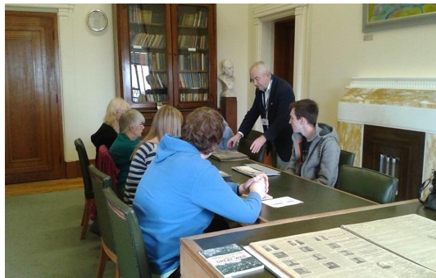
Sesiwn hyfforddi sgiliau ymchwil yn Llyfrgell Genedlaethol Cymru, 17 Hydref 2018

“The study skills session was very helpful and useful. I've learned how to use the microfilm and how to use the NLW computers to search for the information in the newspapers.”