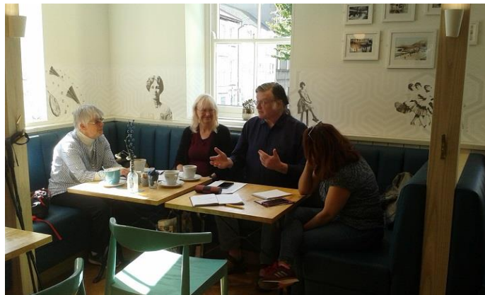
Sesiwn galw heibio i wirfoddolwyr yng nghaffi Amgueddfa Ceredigion

Cafodd y sesiynau anffurfiol hyn eu cynnal yn fisol yn ystod 2018 a 2019 yng nghaffi Amgueddfa Ceredigion, heblaw mis Rhagfyr. Sesiynau agored oedd y rhain lle gallai gwirfoddolwyr ddod i mewn dros gyfnod o ddwy awr, i rannu eu hymchwil a'u darganfyddiadau, gofyn cwestiynau neu godi materion, neu ddal i fyny gyda thîm y prosiect a gwirfoddolwyr eraill dros banded. Bu'r sesiynau'n ddefnyddiol ac yn llawn ysgogiad ac er nad oedd niferoedd mawr yn bresennol, roeddent yn amlwg o werth cymdeithasol mawr yn ogystal â gwerth deallusol i'r grŵp craidd o wirfoddolwyr rheolaidd a ddaeth i bron bob un.