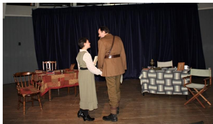
Ymarfer gwisgoedd 'Let Us Be Sweethearts', dydd Mercher 15 Mai 2019