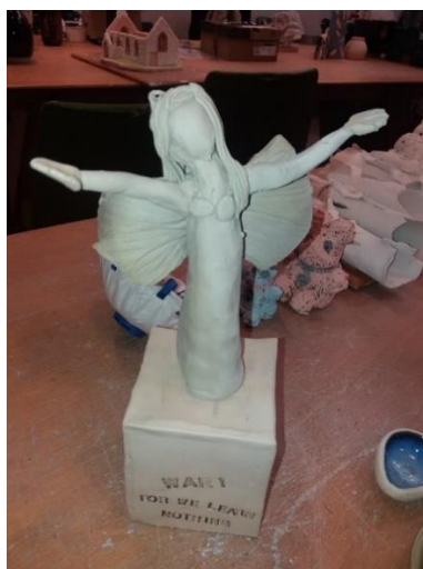
Angel o'r gweithdy crochenwaith i bobl ifanc a ysbrydolwyd gan Gofeb Ryfel Aberystwyth