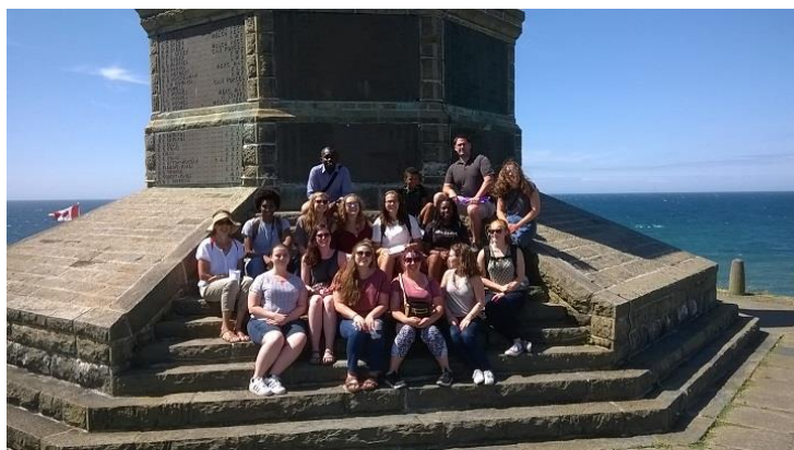
Myfyrwyr Prifysgol y Frenhines, Charlotte, wrth Gofeb Ryfel Aberystwyth, Gorffennaf 2018