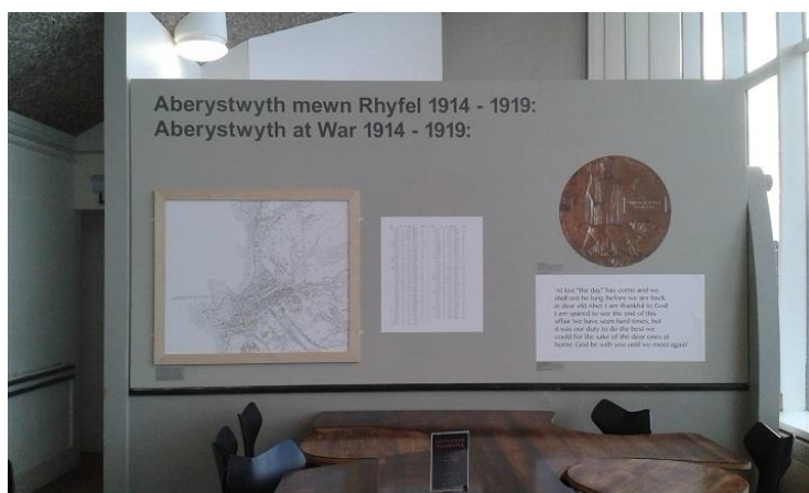
Map o Aberystwyth a Cheiniog Dyn Marw ar wal pen caffi'r Ganolfan