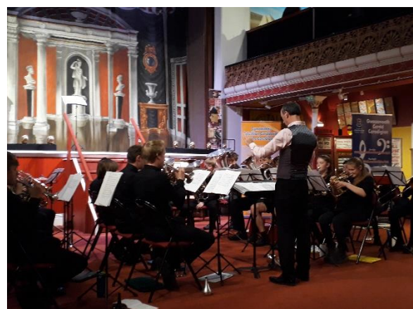
Côr Ysgol Plascrug, a Band Pres Ysgolion Aberystwyth yn perfformio yng nghygerdd 'Caneuon y Rhyfel Mawr', Theatr y Coliseum, Amgueddfa Ceredigion, 22 Mai 2019