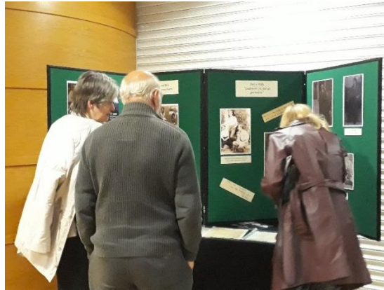
Aelodau o gynulleidfa 'Let Us Be Sweethearts' o flaen y bwrdd arddangos y tu allan i'r theatr