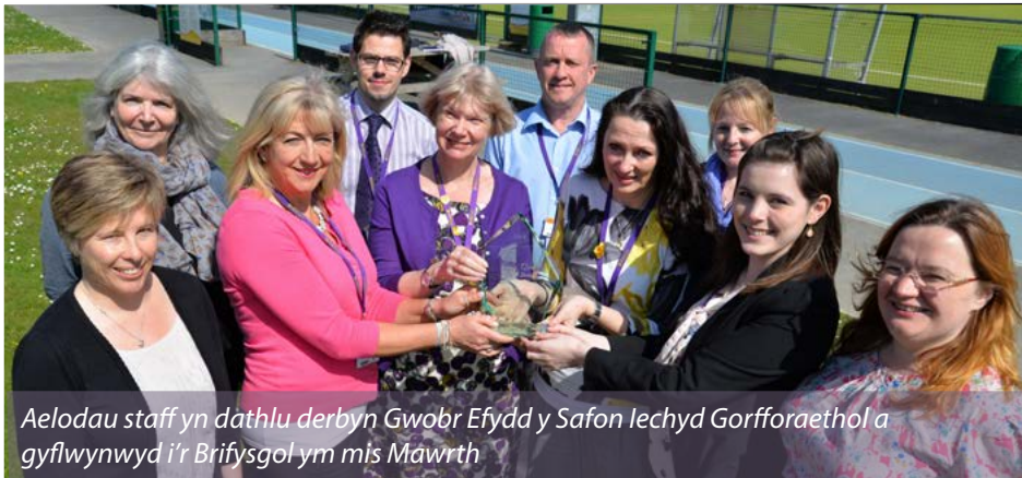
Aelodau staff yn dathlu derbyn Gwobr Efydd y Safon Iechyd Gorfforaethol a gyflwynwyd i'r Brifysgol ym mis Mawrth

Os oes gennych unrhyw gwestiynau ynglŷn ag iechyd a lles staff y Brifysgol, anfonwch e-bost i: wellbeing@aber.ac.uk